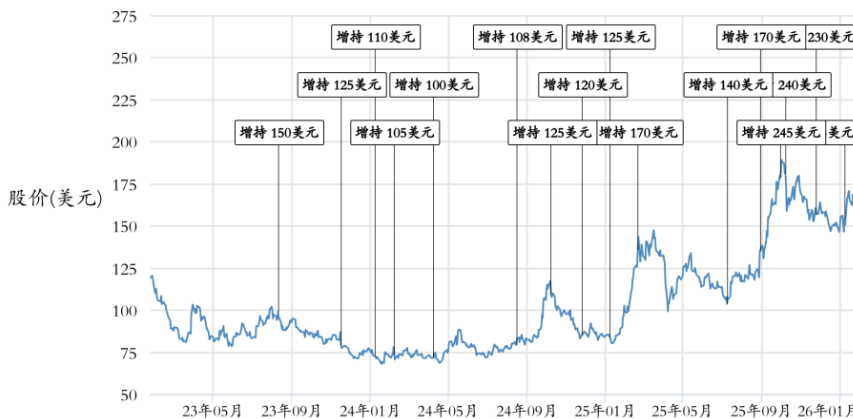
阿里巴巴 (BABA, BABA US) 股价图

股价数据已根据股票拆分及股息作出调整。 首次覆盖 2014年10月29日。所有股价截至上一个交易日市场收市时。